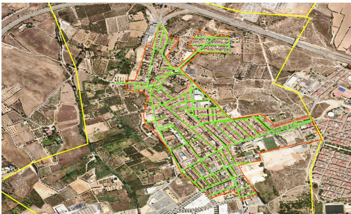
Figura 2. Mapa de carrers i distribució urbana de La Canonja. En groc el límit municipal.